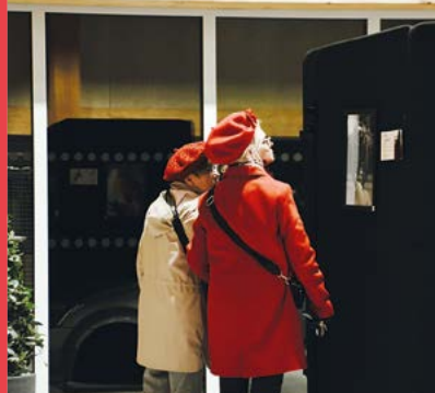
55 portraits ont été exposés O'Centr'Halle, du 3 au 7 décembre, dans le cadre du festival photos de Saint-Saulve, organisé par le service Culture, pour la deuxième année consécutive.