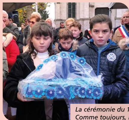
La cérémonie du 11 novembre a rassemblé petits et grands autour du devoir de mémoire. Comme toujours, il s'agit d'un grand moment de communion dans la vie saint-saulvienne.