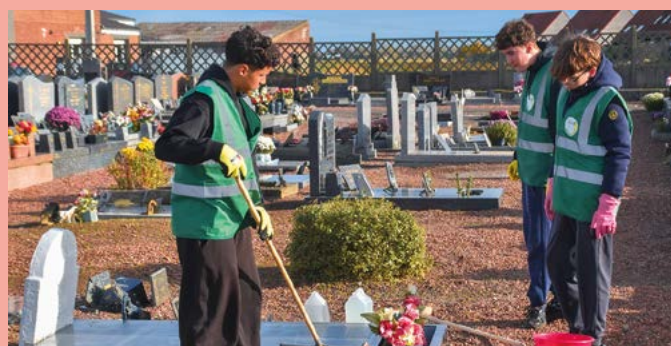
Opération Toussaint: une quinzaine de bénévoles de la ville et neuf jeunes de la Maison de quartier se sont donnés rendez-vous, au cimetière, pour accueillir et aider celles et ceux qui en avaient besoin au nettoyage et au fleurissement des sépultures.