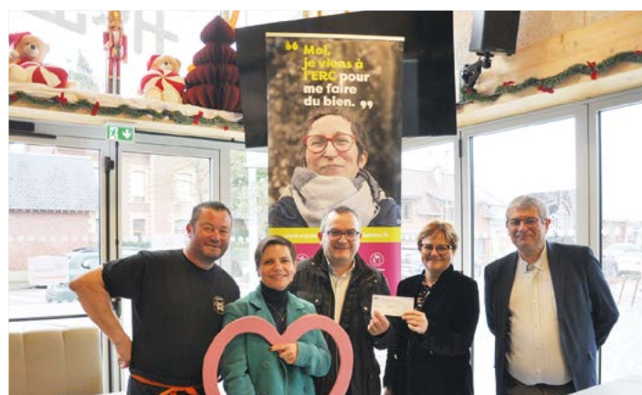
Le restaurant O'bec'Halle a remis un chèque de 500€ à l'association EMERA suite aux recettes récoltées le jour de la marche Octobre rose. Les fonds sont destinés à soutenir la lutte contre le cancer.