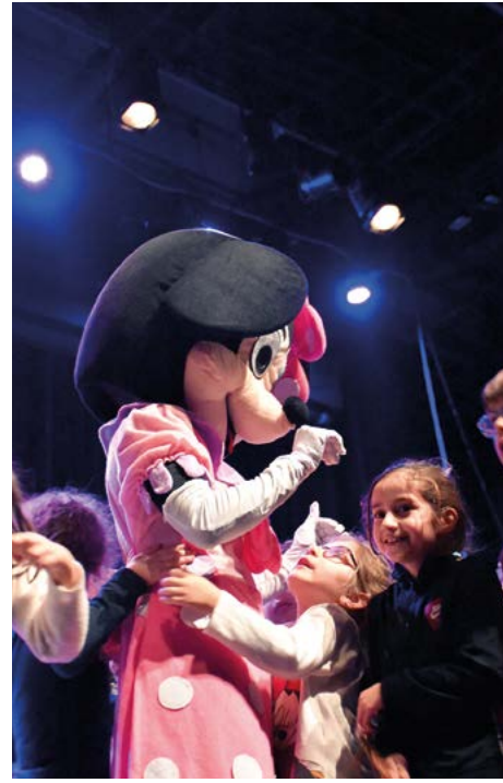
Les 9, 11 et 12 décembre, les écoliers se sont amusés lors d'un super spectacle offert chaque année par la Ville, à l'espace Athéna. Chacun est reparti avec sa coquille, offerte par le Père Noël en personne.