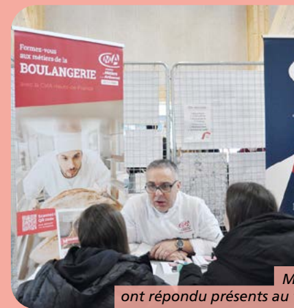
Mercredi 26 novembre, plus d'une vingtaine de partenaires ont répondu présents au forum de l'orientation, organisé par le Service Emploi & Formation O'Centr'Halle.