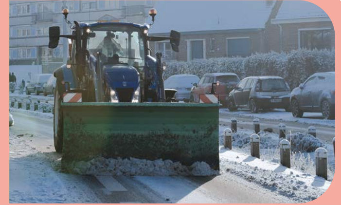
L'année 2026 a commencé tout en blancheur, avec une épaisse couche de neige, venue recouvrir nos rues et nos parcs. Sur les routes principales de la ville, une saleuse et une lame sont passées plusieurs fois depuis les premiers épisodes neigeux. Dès 6h, les agents du Service technique étaient sur les routes, pour dégager le passage, afin de faciliter vos déplacements. D'autres agents étaient, quant à eux, à pied d'oeuvre pour sécuriser les passages piétons et entrées des bâtiments publics.