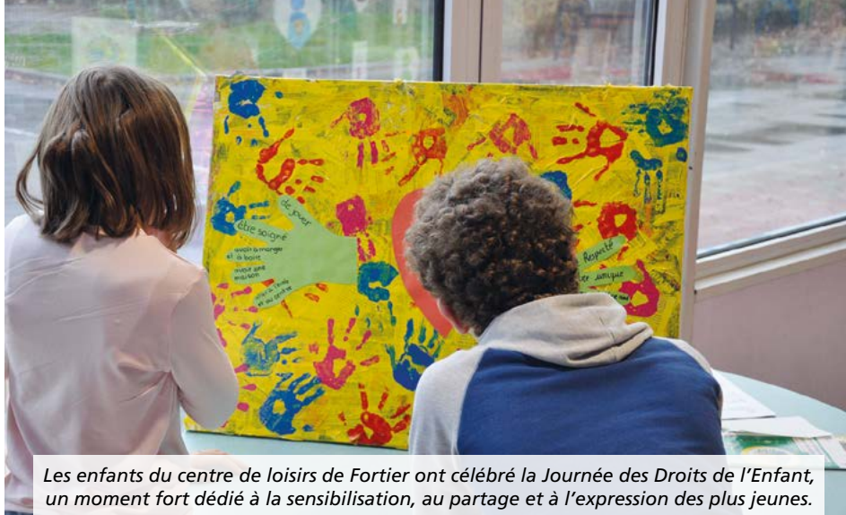
Les enfants du centre de loisirs de Fortier ont célébré la Journée des Droits de l'Enfant, un moment fort dédié à la sensibilisation, au partage et à l'expression des plus jeunes.