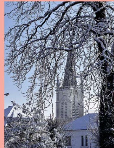
L'environnement a pris des allures de paradis blanc.