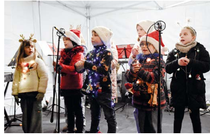
Les 13 et 14 décembre, la magie de Noël s'est emparée du château & parc Fortier, où chalets, animations, spectacles, gourmandises et artisanat attendaient les visiteurs. Des Féeries mémorables !