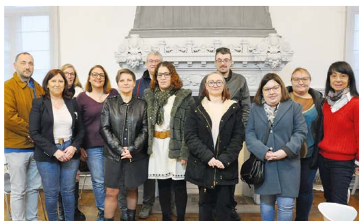
Pour la 2 e année consécutive, la Ville a participé au Duoday, une journée dédiée à l'inclusion des personnes en situation de handicap, dans différents services de la collectivité.